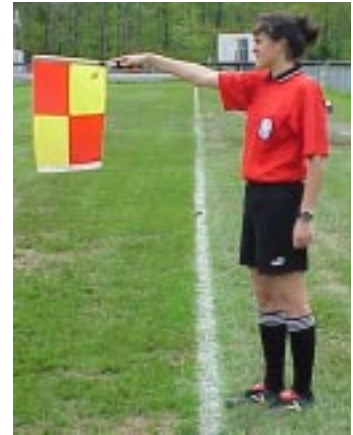
Ill. 25-Hors-jeu au milieu du terrain.