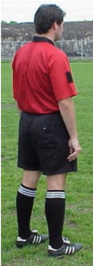
(Illustration 5)-Bas porté correctement.

Les bas, comme les souliers, sont souvent négligés. Les bas doivent être propres et ne doivent pas être percés. Comme nous devons également suivre la mode, il faut savoir que présentement, la mode est aux trois lignes blanches. Évitions de porter des bas tout noir ou n'ayant que deux lignes blanches ou une ligne blanche etc. Les bas doivent être relevés jusqu'en dessous du genoux comme sur l'illustration 5.