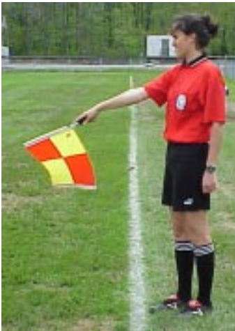
Ill. 26-Hors-jeu du côté rapproché du terrain.