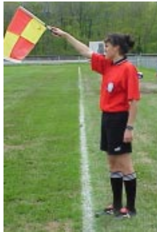
Ill. 24-Hors-jeu du côté opposé du terrain.