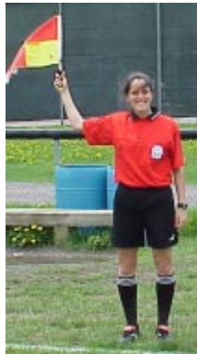
Ill. 27-Attention il faut toujours avoir le bras droit. Éliminer l'angle dans le bras.