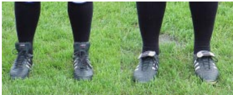
(Illustration 1) Les souliers de gauche sont bien cirés et propres tandis que les souliers de droite sont sales. On peut également voir que le bout des souliers est endommagé.

Souvent négligés, les souliers font partie intégrante de l'uniforme de l'arbitre (illustration 1). Un arbitre devrait avoir dans son sac d'arbitrage, les outils nécessaires au nettoyage des chaussures tels brosses, teinture, graisse etc.