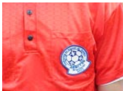
(Illustration 2) NON, c'est tout croche!!

Comme on voit à l'illustration 3, la badge doit être droite et bien retenue sur le chandail de l'arbitre. On utilise habituellement du velcro de façon à pouvoir l'enlever facilement lorsqu'on a à changer de chandail. La badge doit être installée sur la poche gauche du chandail.