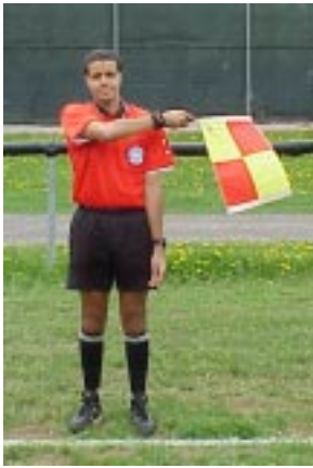
Illustration 23-Ne jamais croiser le bras devant le corps.

Lisez attentivement les notes sous chacune des illustrations car les photos peuvent démontrer des choses à ne pas faire.