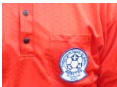
(Illustration 3) Oui, c'est bien droit.